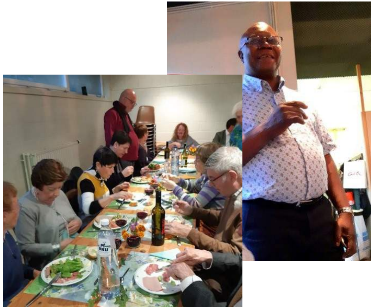
Quelques échos visuels de la fête des bénévoles le 28 septembre dernier.