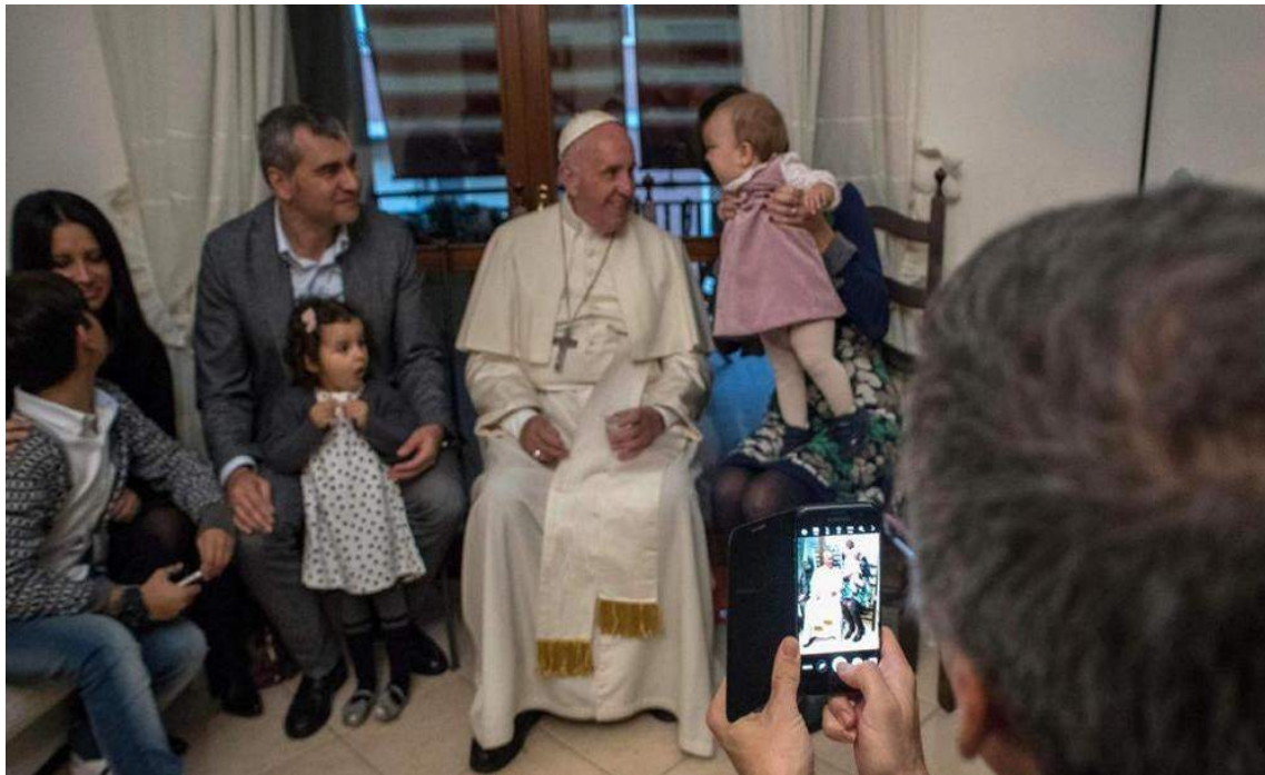
Le Pape visitant une famille le 11 novembre 2016 (il s'agit d'une des 7 familles d'anciens prêtres réduits à l'état laïc et mariés, visitées par François dans le cadre des 'Vendredi de la Miséricorde' de l'Année jubilaire) 3 .

Et réservons dans cette famille un lieu à part pour la prière, personnelle et communautaire. Je vous invite à prier pour que, par une vie de réflexion et d'amour, les familles deviennent toujours davantage des 'laboratoires d'humanisation'».