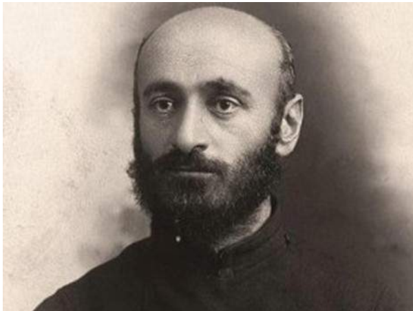
Sghomon Gevorgi (Salomon Georges) KOMITAS

Komitas est le nom en religion de Sghomon Gevorgi Sghomonian, prêtre apostolique et musicien arménien, né en 1869 dans l'Empire ottoman, et mort en 1935 à Villejuif en France.