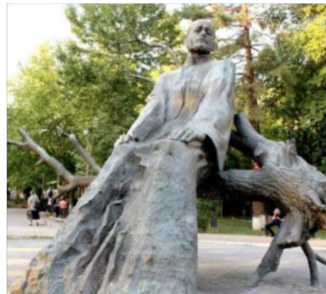
Statue de Komitas à Erevan (Arménie)

Mais les nombreuses parties publiées ont donné une dynamique toujours sensible aujourd'hui au renouveau de la musique arménienne.